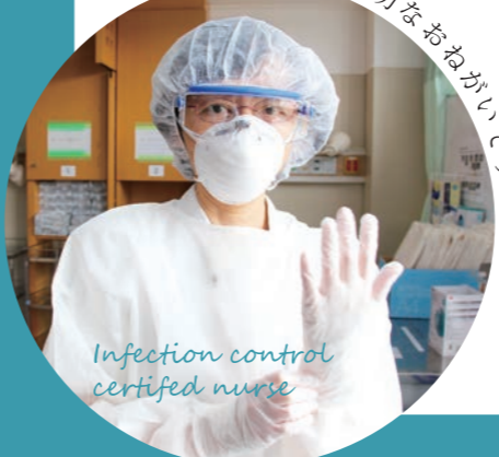
Infection control certified nurse

ワクチンを接種しても 100%感染を防ぐことはできません。デルタ株など感染力の強い変異株も増加してきています。ワクチン接種が終わっても油断しないようにしましょう。これまで通り3密を避け、マスクの着用と手洗い、手指のアルコール消毒を徹底してください。また、待合室での会話や携帯電話での通話も控えてください。