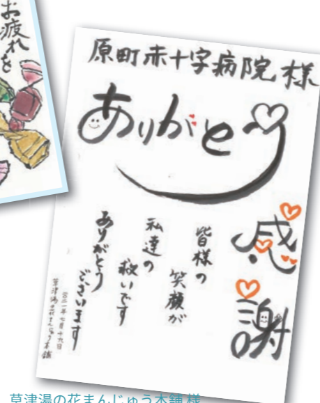
草津湯の花まんじゅう本舗 様