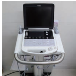
パナソニック ライフソリューションズ朝日株式会社 様